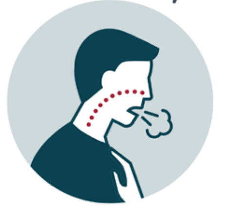
صعوبة في التنفس